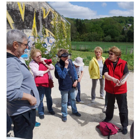
Balade du 23 avril 2018 : la Bièvre