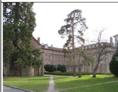
Domaine de Bel Air