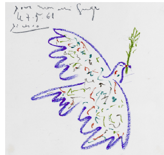
Colombe de la paix Picasso