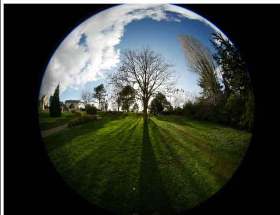
La mare du Tonkin Le bout du tunnel Fisheye Claude Gallas