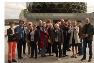
A la Seine Musicale le 16 octobre 2022

ACCUEIL/SORTIES de www.seniors-de-saclay.jimdofree.com