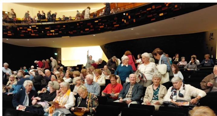
Concert « Six Nations » à la Philharmonie