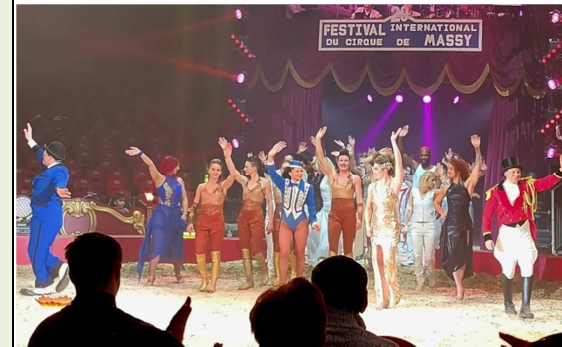
02 février: 🎪 Festival internat. du Cirque de Massy