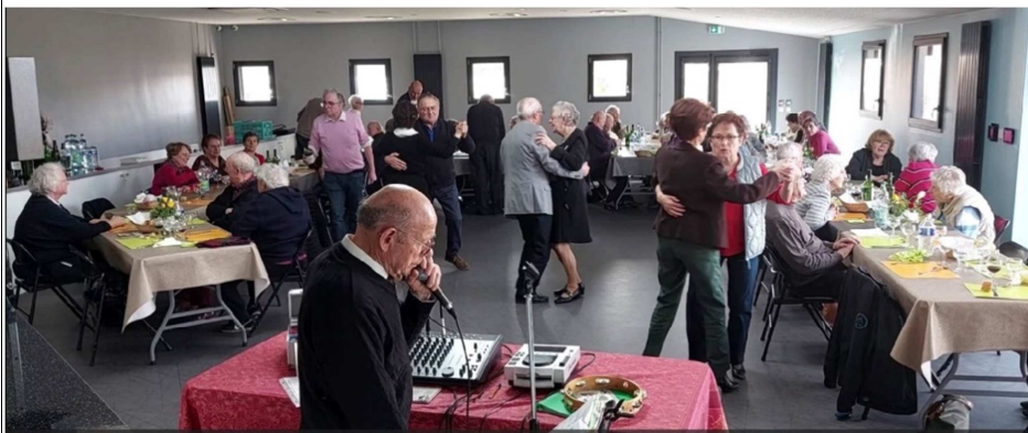
Une adhérente des Seniors fait le spectacle →