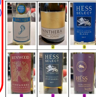
La « casse en bois »